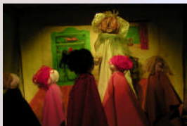
Burattini, ombre ed attori

Spettacoli per bambini Dai tre ai dieci anni