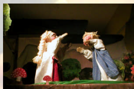
regia di Ludovico Caldarera

Direzione Artistica: Ludovico Caldarera Organizzazione: Rosalba Patricola